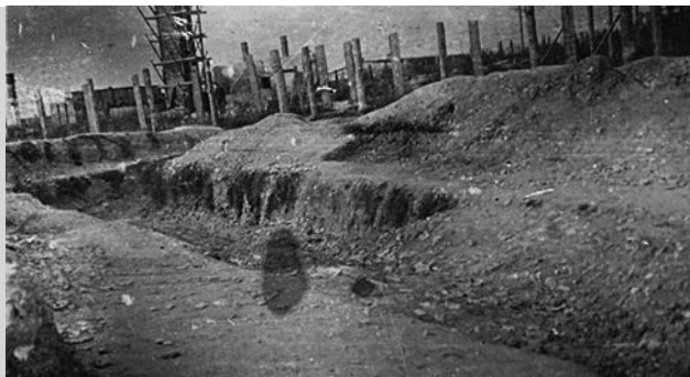
Historische Abbildung der Erschießungsgräben von 1943. Die Gräben hatten eine Länge von etwa 100m und eine Tiefe bis zu 3m.

„Am Morgen des 3.11.1943 kam jemand und sagte, es gebe eine Sonderaktion und zwei Liter Schnaps und 200 oder 400 Zigaretten für den, der mitmachen wolle. Als damals von der Teilnahme an einer Sonderaktion die Rede war, wusste ich, dass damit Erschießungen gemeint waren. An dem Tag wurde das Lager in Alarm versetzt. Ein Teil der Hundestaffel wurde auf Außenposten geschickt. Man konnte das Heranbringen der auswärtigen Juden sehen. Das Schießen war auch von meinem Posten zu hören. Das Schießen ging bis zum Einbruch der Dunkelheit.“