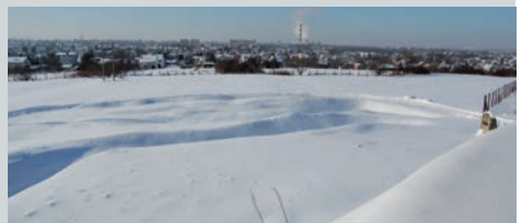
Ansicht der Gräben 2013.